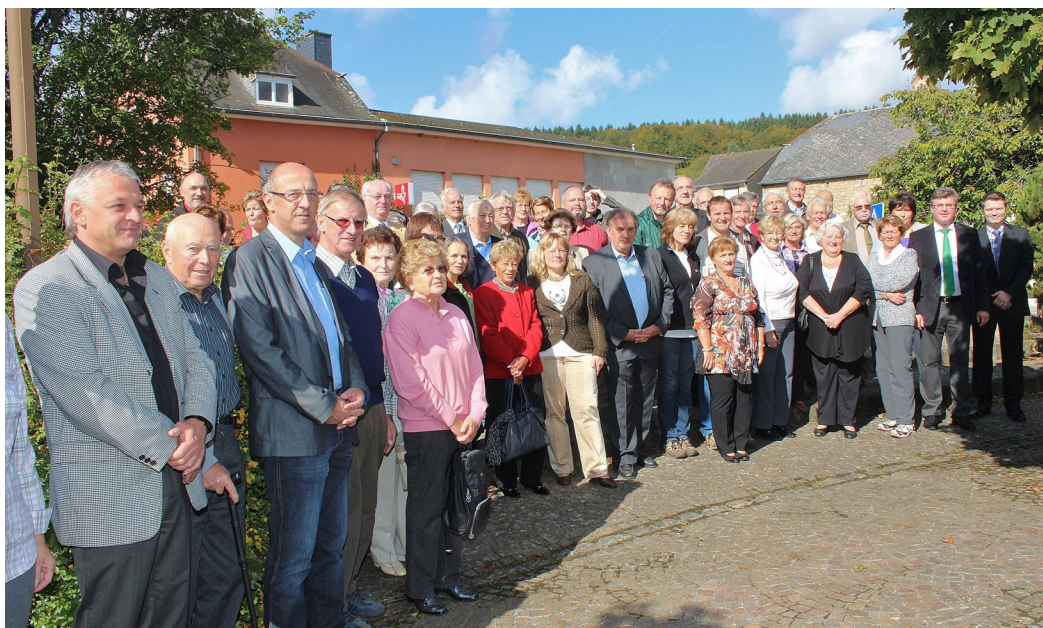
Photo prise le 30 septembre 2012 lors du 500 me Apéro-tour de l'Asivema (Entente des offices de tourisme et des communes des vallées de l'Eisch, de la Mamer et de l'Attert).

Pour le programme des Apéro-Tours, veuillez consulter le site: