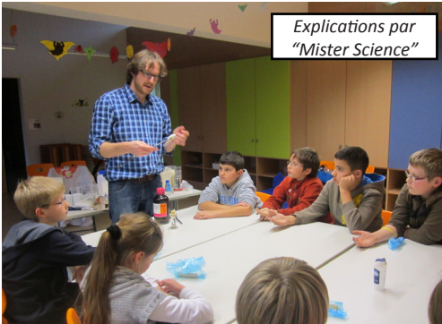
Explications par "Mister Science"

La ScienceWeek a été organisée par l'Association des parents en collaboration avec les enseignants de l'école et le musée national d'histoire naturelle (MNHN). Le 16 novembre, les parents sont venus voir les projets réalisés par les enfants. Principales activités: Projets de découverte dans le Science Mobil, Planetarium gonflable, ateliers de bricolage.